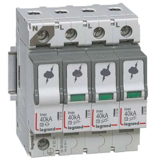
УЗИП типа T2

С уважением, Представительство Legrand в Украине